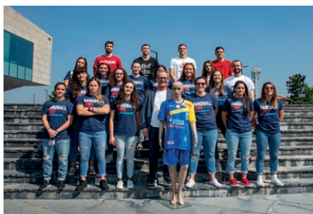
Fondazione Dominato Leonense, autunno di corsi