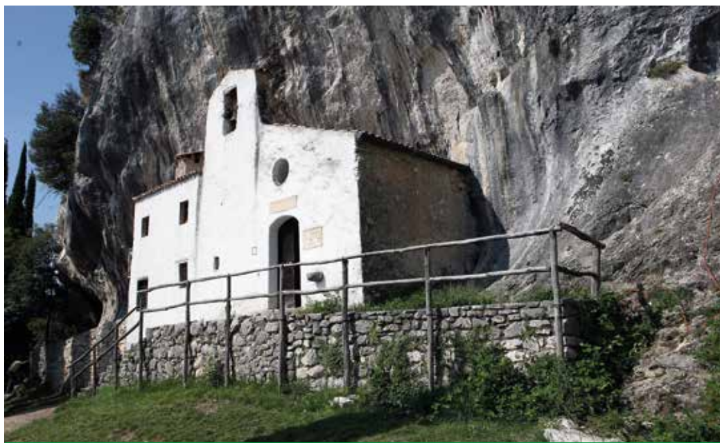
Eremo di San Valentino

piccolo porticciolo di Tignale e il Prato della Fame. Sotto il ponte della vecchia strada Gardesana ritroveremo i segni dell'eremo, con alcune celle, ora diroccate, il nero lasciato probabilmente dall'antica cucina. Nulla o poco più è rimasto dei 52 scalini che salivano all'eremo e alla chiesa di San Giorgio, sventrati nel 1929 durante la costruzione della Gardesana. Possiamo terminare qui il percorso ritornando con mezzi pubblici a recuperare la macchina, oppure pagaiare di nuovo verso Gargnano. ●