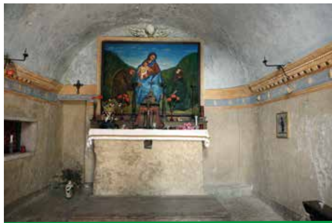
Interno dell'Eremo di San Valentino

Percorrendo la costa si possono, infatti, ammirare le limonaie aggrappate e un susseguirsi di residenze sino alla piccola insenatura del porticciolo dei pescatori, dove spiaggiando la canoa possiamo visitare la chiesetta di San Giacomo (XII secolo), protettore dei pellegrini. Ripartiti, sfiliamo dinnanzi alle ultime dimore che s'affacciano al lago, alcune ricavate dalle strutture delle limonaie, altre da case di pescatori, con alcuni inserti fuori luogo di nuove abitazioni vacanziera.